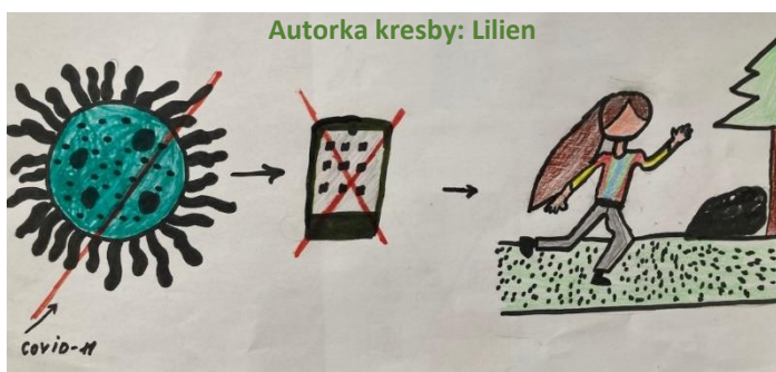
Autorka kresby: Lilien