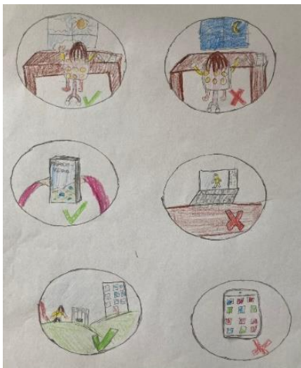
Autorky kreseb: Monika Verča