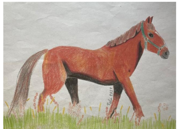
Kresby do časopisu poskytla Nela Andrusová, 3. C žákyně výtvarného oboru ZUŠ Líbeznice

„Chci říct, ať vás nic nebo někdo nezastaví, protože všechno jde, když se chce. Já vám totiž věřím!“