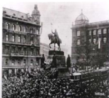
vypracoval: Matyáš Havlík, Miloš Kučera